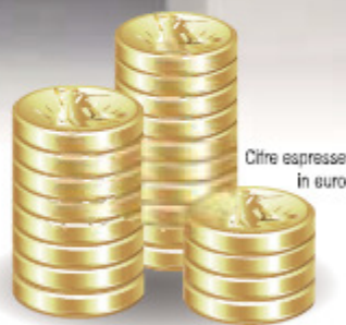
Cifre espresse in euro

15 milioni spesi in più dagli enti locali per servizi straordinari di smaltimento rifiuti e rimozione neve