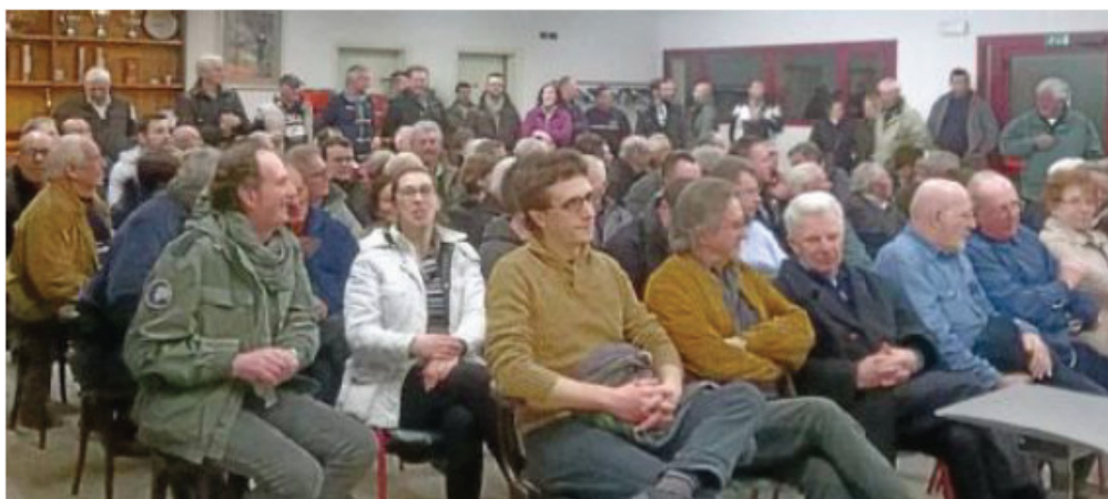
Le persone presenti all'affollata assemblea sulla questione dell'innalzamento delle falde. ARMENI

Tensione alle stelle e lite sfiorata venerdì sera a Novoledo, per la riunione pubblica sul problema dell'innalzamento delle falde. Con centinaia di persone costrette da febbraio ad aspirare l'acqua da scantinati e taverne, che la serata potesse trasformarsi in un ring non era un mistero per nessuno. Tantomeno per il primo cittadino di Villaverla Ruggero Gonzo che, presentando gli ospiti del tavolo tecnico, ha avvertito gli oltre duecento cittadini accorsi in sala Accebbi: «Questo è un incontro informativo, per cercare di trovare una soluzione, non per polemizzare». Alla presenza dei vertici del consorzio di bonifica Alta pianura veneta, il presidente Antonio Nani, il direttore Gianfranco Battistello e il tecnico e sindaco di Montecchio Precalcino Imerio Borriero, gli animi dei villaverlesi si sono però scaldati in fretta, nonostante la promessa del consorzio di fare tutto ciò che sarà necessario per contribuire ad abbassare la falda, che supera ora quota 56 metri. «Ci dovete risarcire invece, perchè è col-