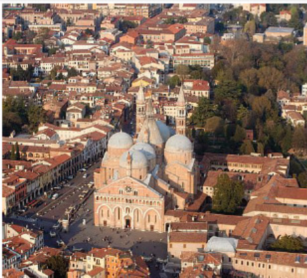
Una foto dall'alto della basilica del Santo

lagamenti a cui intere aree della città sono soggette per mancanza di un adeguato assorbimento dell'acqua piovana (vedi Forcellini-Parco Iris) e dall'errato calcolo della Superficie agricola utilizzata (Sau). I fenomeni di dissesto idrogeologico che si sono acuiti in questi 5 anni non possono essere ignorati nel momento dell'approvazione dello strumento urbanistico (Pat) che determina per i prossimi 10 anni il governo delle trasformazioni urbane».