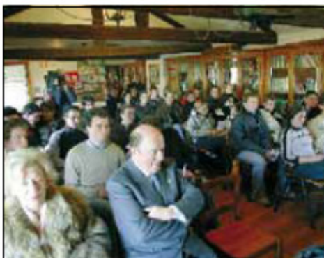
CONVEGNO L'auditorium dell'agrario Parolini