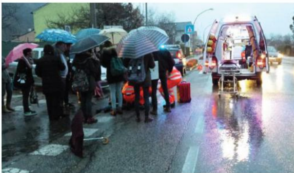
Uno degli ultimi gravi incidenti avvenuti a Piovene. Ora l'amministrazione corre ai ripari

«Considerati gli incidenti che sono avvenuti lungo le arterie 349 e 350 - spiega l'assessore ai lavori pubblici Mauri-