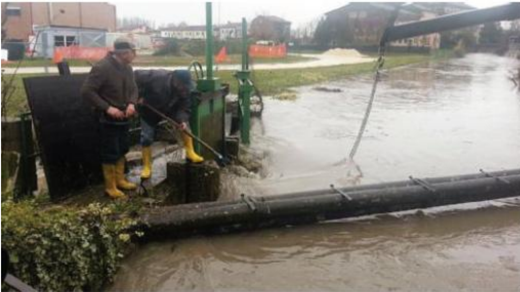
I tecnici del Consorzio al lavoro lungo il Tartaro per la pulizia della paratoia vicino al Palarisi