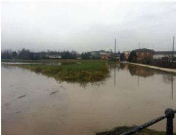
La situazione alla Giarella, a monte dell'intervento sul Tartaro

zione dello scolo Gambiva. Nessun problema, invece, a Villafranca. Il Tartaro, che in passato costituiva spesso una fonte di problemi, in questo tratto non ha creato nessun pericolo. Anzi, le forti precipita-