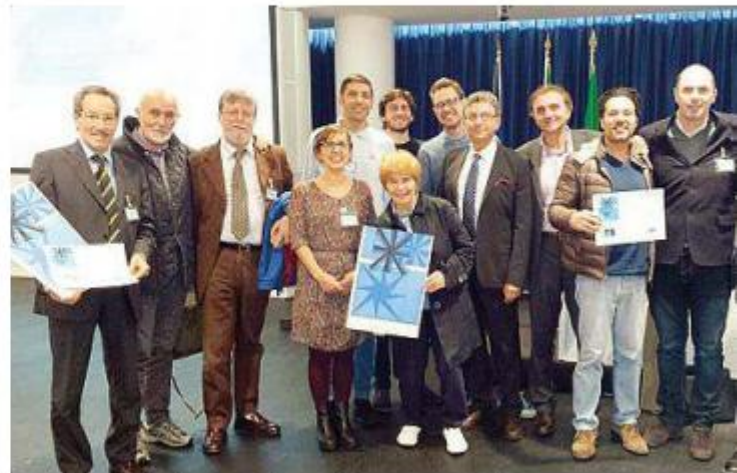
Un momento della premiazione del contratto di fiume