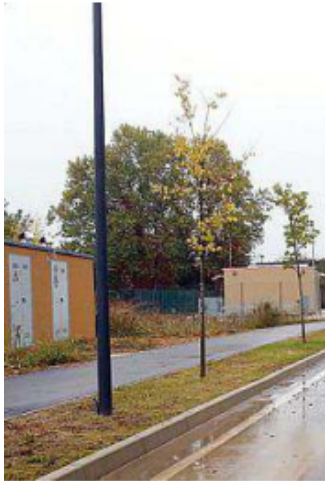
Gli impianti appena collaudati