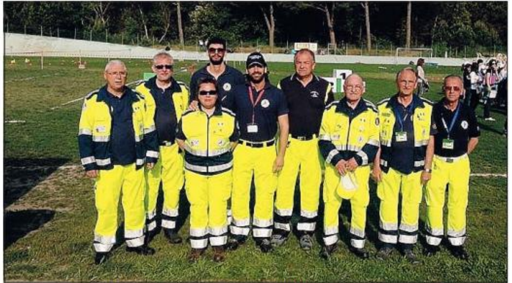
Due immagini dei volontari del gruppo di Protezione civile di Porto Viro, che sabato festeggia i 10 anni

Quindi ci sarà la presentazione agli alunni delle classi terze del progetto "A scuola con la Protezione civile" e successivamente un