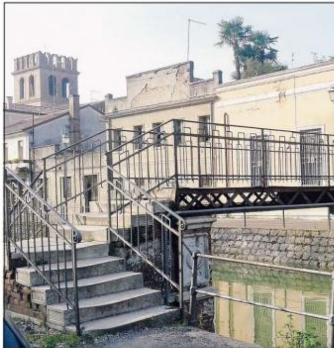
La passerella di via Perolari

dalla giunta, che ha rinviato l'approvazione della copertura finanziaria, prevede una spesa complessiva di 187mila euro, a cui l'amministrazione pensa di dare copertura utilizzando circa 14mila euro del bilancio d'esercizio 2015, 29mila euro circa da risorse comunali da iscriverne a bilancio 2016 ed