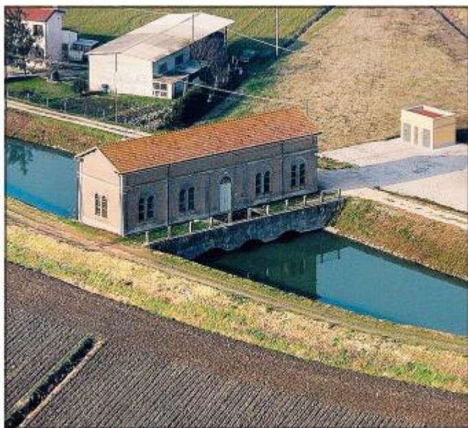
L'idrovora di San Marco a Sarzano