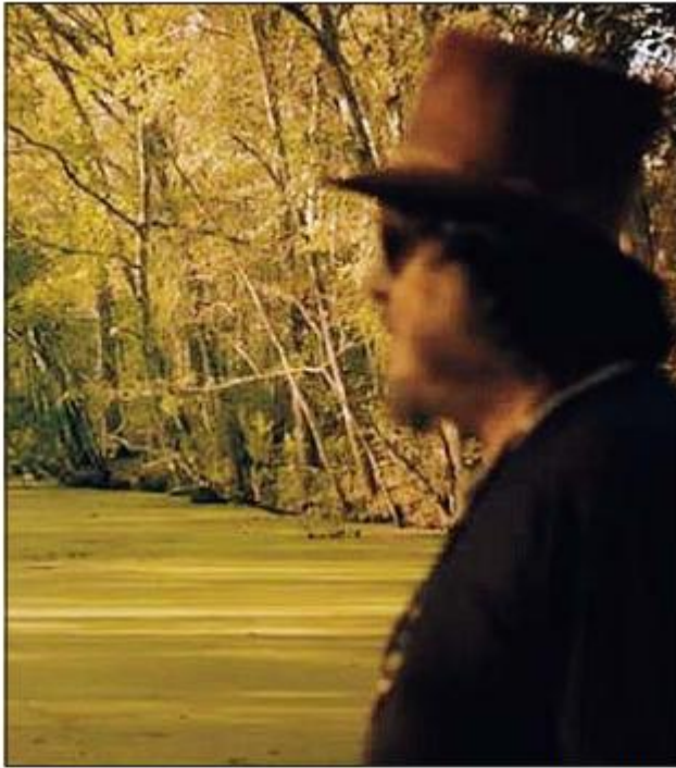
Zucchero ha girato il suo singolo "Voci" nel Delta del Po

fosse un faro. Le figure si perdono nel serpeggiante percorso delle valli che si srotolano nelle zone umide di Rosolina e toccano le otto valli. I grandi specchi lagunari e il volo dei fenicotteri rosa. E dalla finestra affacciata sulla natura si intravede il piccolo oratorio Mazzucoco a fianco della Valle Pozzatini. Due innamorati indugiano seduti