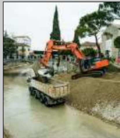
MANUTENZIONI Via l'obbligo di autorizzazione paesaggistica

VENEZIA - Con il collegato alla Legge di Stabilità 2017 il consiglio regionale del Veneto ha approvato una norma con cui si prevede che gli interventi di manutenzione degli alvei finalizzati a garantire il libero deflusso delle acque possano essere eseguiti senza necessità di autorizzazione paesaggistica. «L'attività di manutenzione - fa presente l'assessore regionale alla difesa del suolo Gianpaolo Bottacin - deve poter essere svolta continuativamente e con prontezza non appena vi sia la necessità. Se non si semplificano le procedure, mentre si producono metri cubi di carta, si rischia che succeda che cadano i ponti come è capitato recentemente in altre realtà».