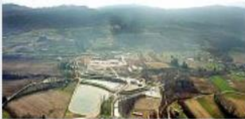
Suolo agricolo e capannoni industriali nel trevigiano

«Non è solo una legge che dice "stop", che esaurisce la sua funzione mettendo al bando l'inutile occupazione di suolo non ancora urbanizzato, è anche uno strumento che promuove una grande azione di semplificazione per favorire la rigenerazione di strutture obsolete e volumi improduttivi, in una logica di qualità, funzionalità e modernità». Il governatore Luca Zaia spiega cos'è la legge sul consumo di suolo approvata dal consiglio Regionale lo scorso 29 maggio, una legge quadro alla quale il Corriere del Veneto dedica Contenimento del suolo e rigenerazione urbana , commentario di approfondimento a cura dell'avvocato Bruno Barel da domani in edicola (prezzo di copertina 6,80 euro più il prezzo del quotidiano). Articolo per articolo, comma per comma, nel libro della collana «Legislazione Veneta», i dirigenti della Regione esplicitano nel dettaglio ambiti e limiti di applicazione della legge, inquadrando il problema del consumo di suolo in Italia e lo stato della legislazione nazionale e comunitaria.