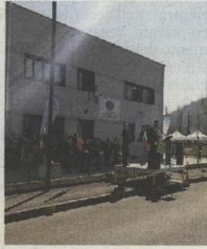
INAUGURAZIONE La nuova sede della protezione civile

La proprietà intellettuale è riconducibile alla fonte specificata in testa alla pagina. Il ritaglio stampa è da intendersi per uso privato