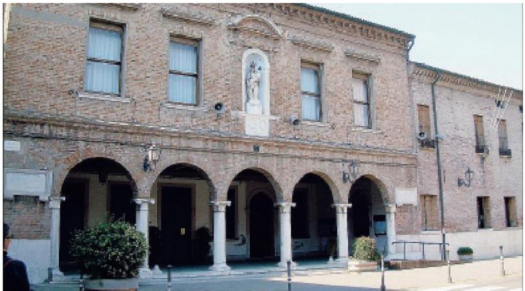
Il comune di Lendinara

stringersi a due metri nel tratto finale, e un cordolo di cinquanta centimetri la separerà dal traffico. Il nuovo tratto di pista ciclo-pedonale andrà a rendere più fruibile per i cittadini la riviera dell'Adigetto più vicina al cuore della città e alle piazze, dopo che sono stati ultimati i lavori proprio al ponte nuovo in Riviera del Popolo, che hanno eliminato le barriere architettoniche.