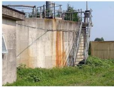
Il depuratore di Oppeano verrà raddoppiato

Le opere per raddoppiare il depuratore rientrano negli obiettivi del Piano d'ambito e rappresentano un primo