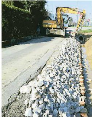
Il cantiere in via Micca

I lavori prevedono il risizionamento del fossato attraverso lo scavo del fondo per un tratto di circa 300 metri e un intervento di difesa delle