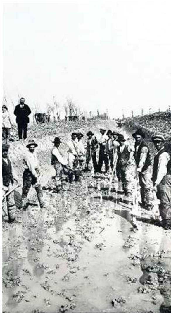
IL PASSATO Nel 1800 la tenuta era una palude malsana. Sopra, una foto d'epoca con i contadini impegnati nel lavoro di recupero a lato uno spaccato della maestosa tenuta che si trova nel territorio di Caorle