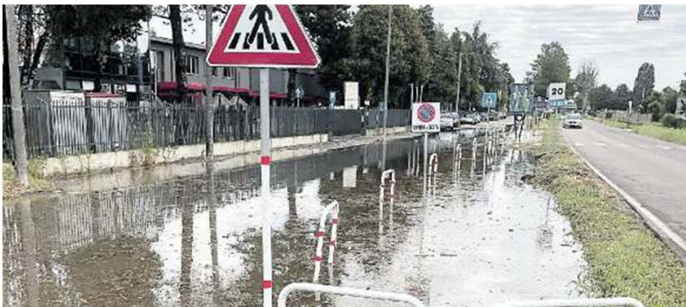
VIA CA' MIGNOLA NUOVA La zona rimasta allagata davanti all'azienda Emporio Borsari dopo l'acquazzone di sabato scorso