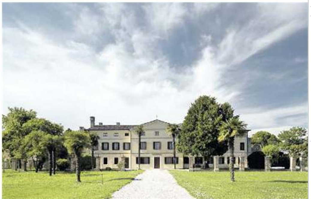
CAORLE Una veduta di Ca' Corniani, la più importante sede di Genagricola, la divisione agricoltura delle Generali, e sotto un'immagine della metà del 1800

DOPO LA BONIFICA CI VIVEVANO E LAVORAVANO SETTECENTO FAMIGLIE MA CON LA GUERRA TORNÒ LA DESOLAZIONE