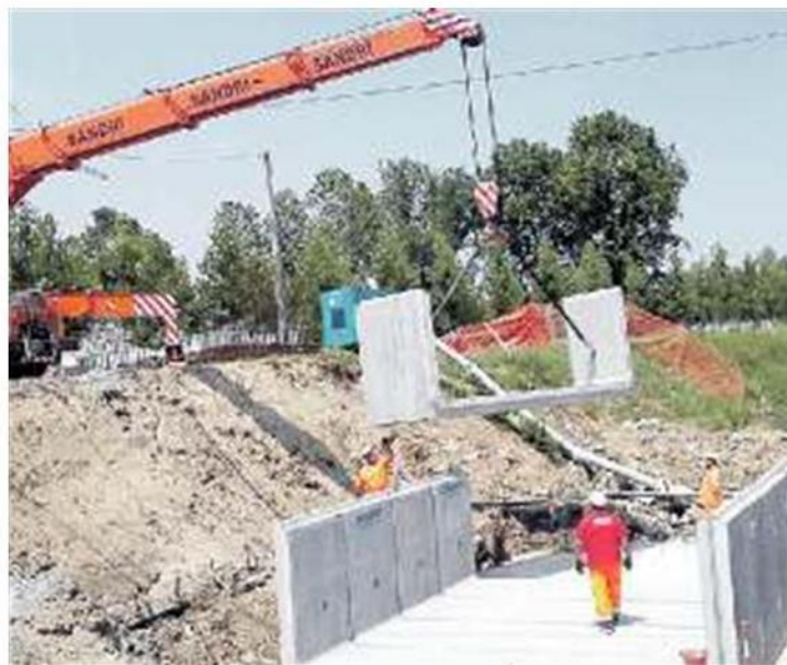
LISSARO Procedono i lavori per realizzare il nuovo ponte

L'OPERA È COSTATA AL COMUNE 135 MILA EURO