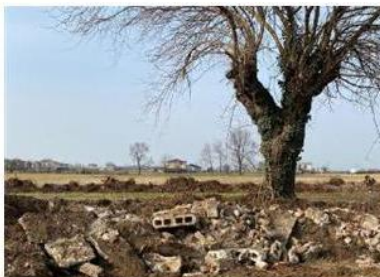
L'area lungo la strada ciclopedonale che verrà ripristinata

Dopo la tempesta scatenata dall'abbattimento di alcune piante lungo la strada ciclopedonale di via Stracozzo, tra sindaco e proprietari dell'area sembra tornata la pace. A tendere la mano è stata la proprietà dell'appezzamento, garantendo il ripristino del tratto interessato dalla bonifica che ha scatenato le polemiche. «A seguito della forte presa di posizione del Comune di Sandrigo, la società Agricola Zanettin con un atto di responsabilità ambientale, ci ha inoltrato una lettera nella quale, oltre a spiegare le motivazioni per cui sono stati effettuati i lavori, ha espresso la volontà di procedere con il ripristino ambientale dell'area interessata», dichiara il sindaco Giuliano Stivan. «In questo senso ieri mi sono incontrato, assistito dagli uffici tecnici, con i rappresentanti della società agricola». Dal colloquio è emersa la volontà di sottoscrivere un documento congiunto tra pubblica amministrazione e privati in cui è previsto l'adempimento di impegni precisi da parte dell'azienda Zanettin. «Verranno ripristinate le alberature espianate con piante tipiche del nostro territorio, come carpini o aceri campestri, per tutta la lun-