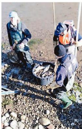
Salvataggio di pesci

L'asciutta dei canali, che durerà fino al 4 marzo, vedrà al lavoro circa 70 persone tra operai consorziali e personale avventizio appositamente assunto per questo periodo: si tratta di lavori di manutenzione e riparazione di paratoie di canali secondari e terziari, interventi di stuccatura e riparazione a canalette e manufatti in cemento armato, espurghi e pulizie varie su canali e bacini, manutenzione ed eventuale sostituzione di saracinesche, manutenzioni e pulizie su impianti e centraline consorziali. Si farà ricor-