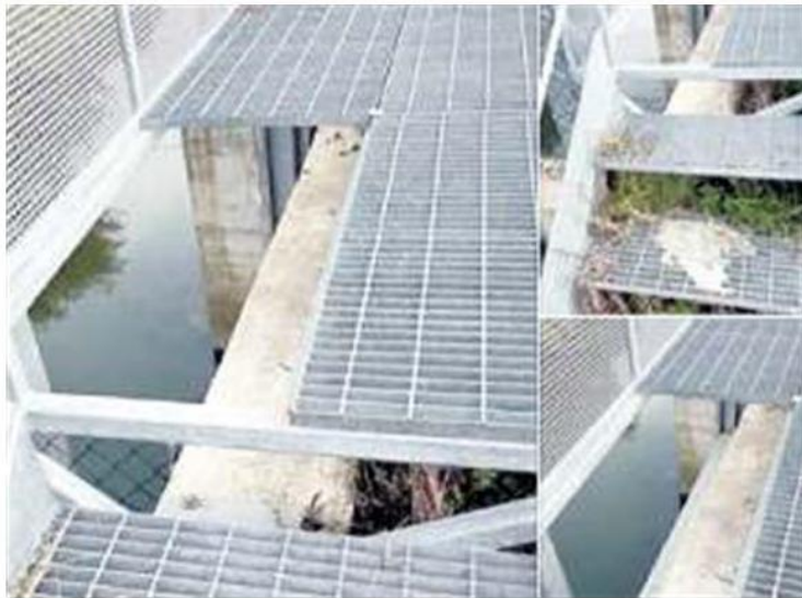
LO SQUARCIO Lungo la passerella sullo scolo consortile