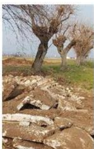
Un'immagine dei lavori

ghezza del tratto interessato. Anche i terreni adiacenti alla strada comunale saranno sistemati. La proprietà, inoltre, parteciperà alla ridefinizione degli esatti confini di via Stracozzo e si impegnerà a definire col consorzio Brenta il ripristino del manufatto presente nella roggia Seriola», conclude Stivan. «Considerato ciò, con la consapevolezza che a breve chi passerà potrà tornare a farlo in un contesto di verde analogo a quello precedente, il Comune si impegna a non procedere con procedimenti amministrativi». ■ M.A.B.I.