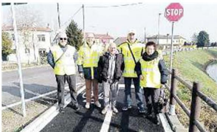
VILLADOSE L'attesa inaugurazione della nuova pista ciclabile lungo l'Adigetto verso Cambio