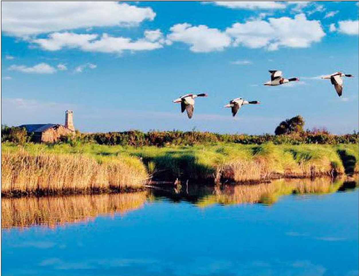
Il progetto "Terre d'acqua, terre nell'acqua. Delta del Po e Venezia" è coordinato dal Parco Regionale Veneto del Delta del Po

La proprietà intellettuale è riconducibile alla fonte specificata in testa alla pagina. Il ritaglio stampa è da intendersi per uso privato