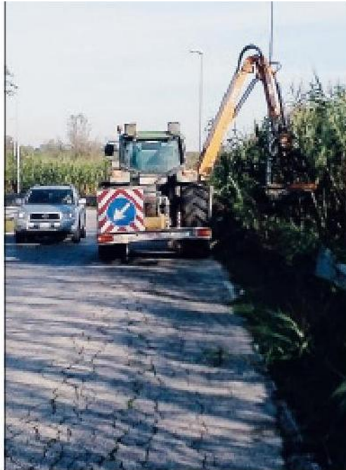
Lo sfalcio del verde negli svincoli della Romea

La proprietà intellettuale è riconducibile alla fonte specificata in testa alla pagina. Il ritaglio stampa è da intendersi per uso privato