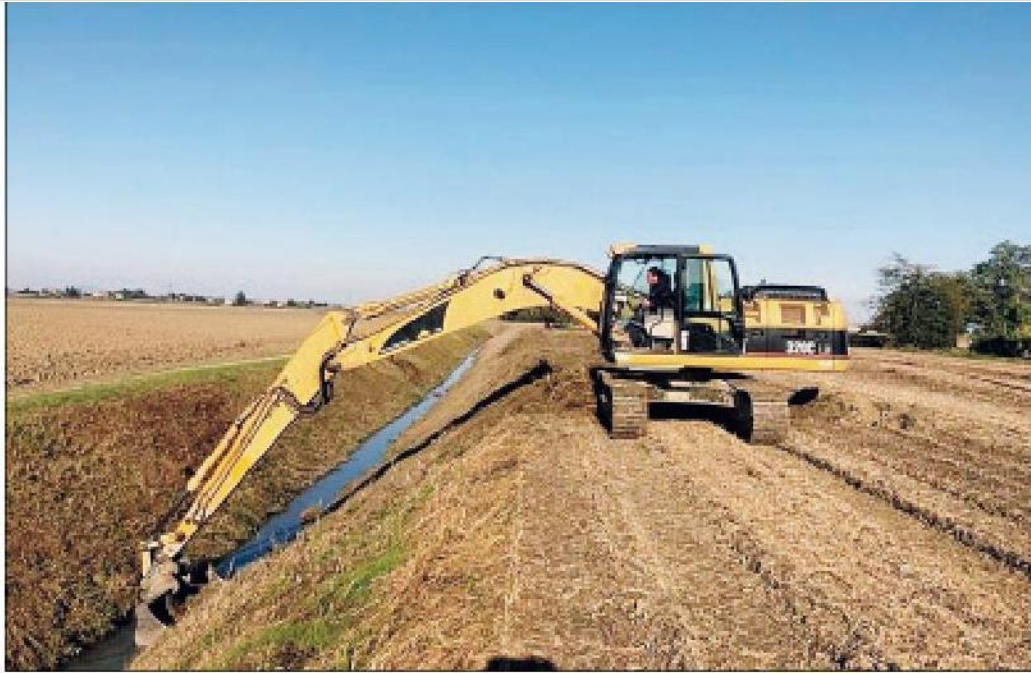
Attenzione costante alla sicurezza idrogeologica Da parte del Consorzio di bonifica

La proprietà intellettuale è riconducibile alla fonte specificata in testa alla pagina. Il ritaglio stampa è da intendersi per uso privato