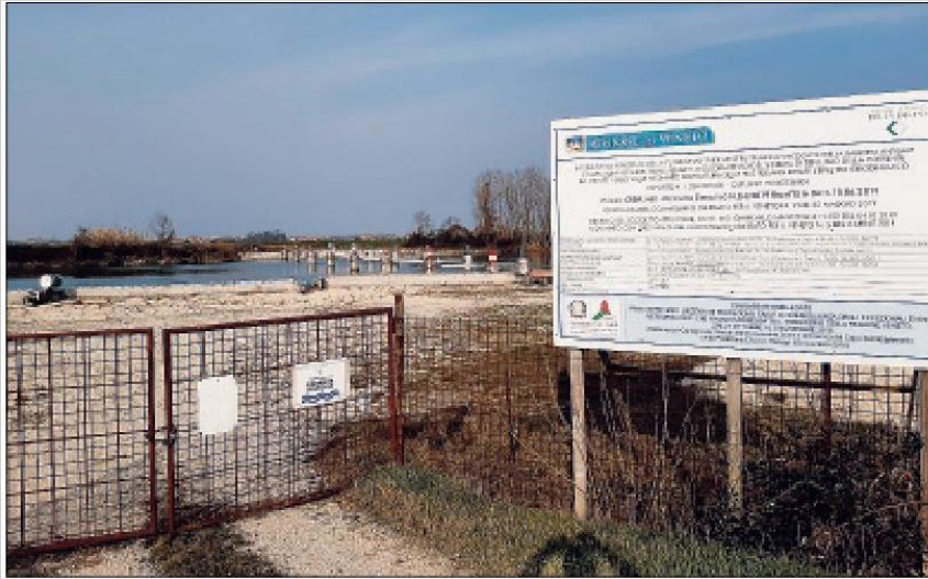
Il cantiere del ponte sull'Adige Unirà Rosolina Mare e Isola Verde ed è stata una delle tappe toccate dalla pedalata di "riscaldamento" dei Free Bikers