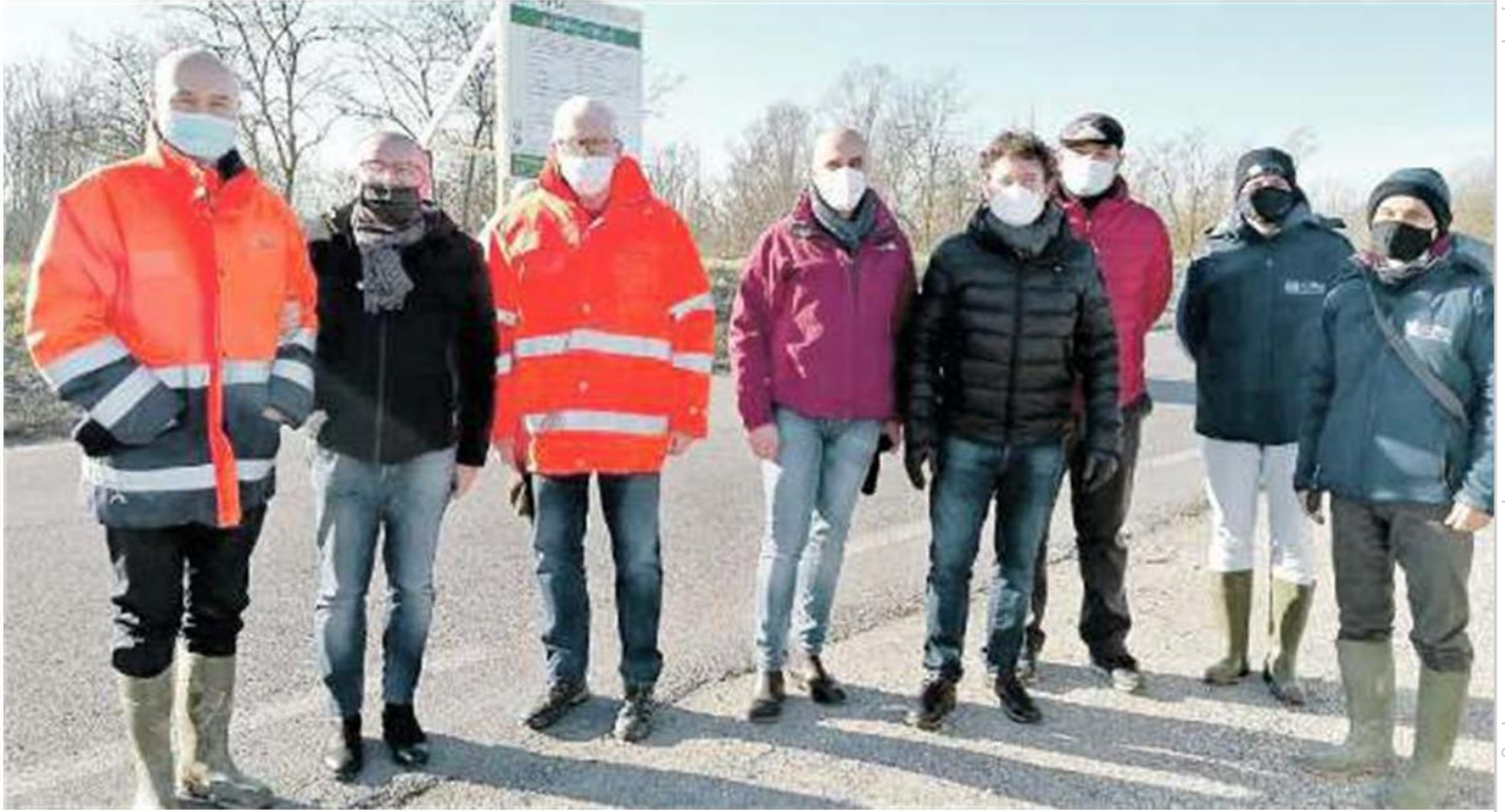
ADRIA La consegna con l'avvio ufficiale dei lavori alla presenza di Aipo, Comune e impresa realizzatrice

La proprietà intellettuale è riconducibile alla fonte specificata in testa alla pagina. Il ritaglio stampa è da intendersi per uso privato