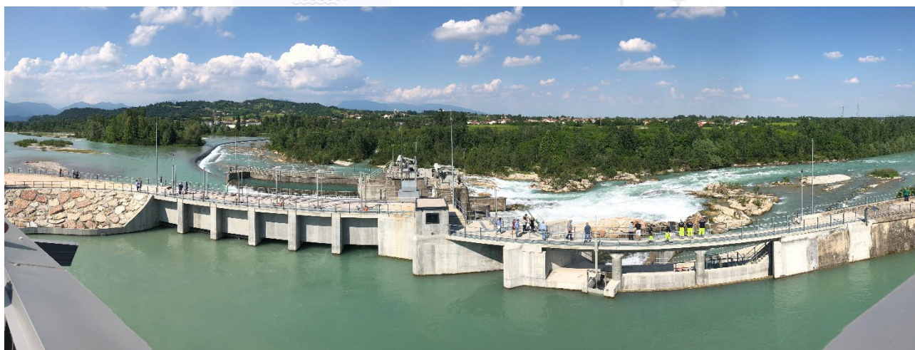
Nervesa della Battaglia